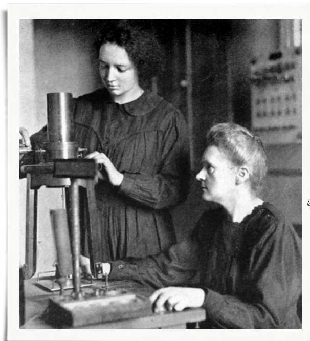
De eerste klinisch fysici. Links Irene Joliot-Curie en rechts haar moeder Marie Curie. Zij maakten samen in de eerste wereldoorlog röntgenfoto's van gewonde soldaten.

Het Kennis- en dienstverleningscentrum van de Federatie Medisch Specialisten en de LAD verwacht over heel 2020 circa 2.800 vragen in behandeling te hebben genomen. Aan het eind van het derde kwartaal stond de teller op 2.069. De meeste vragen zijn arbeidsrechtelijk van aard (59%). Runner up zijn met 14% de vragen over gezondheids- en ondernemingsrecht.