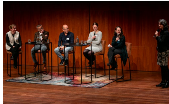
▲ SRI-symposium in TivoliVredenburg. ▲

Op 14 november vond het jaarlijkse symposium plaats van het Samenwerkingsverband Richtlijnen Infectiepreventie (SRI) in Utrecht. Hoe Artificial Intelligence (AI) de zorgsector verandert en wat dit betekent voor de praktijk van de infectiepreventie, vormde de centrale vraag tijdens dit symposium. Daarnaast was er aandacht voor enkele nieuwe SRI-richtlijnen.