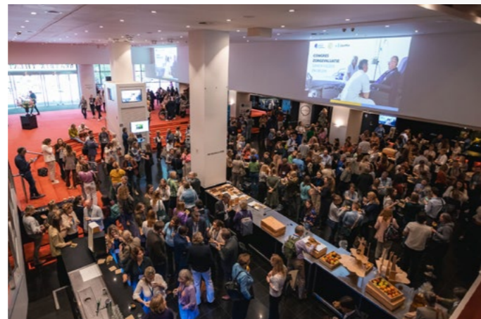
▲ Het congres Zorgevaluatie in het Beatrix Theater in Utrecht.