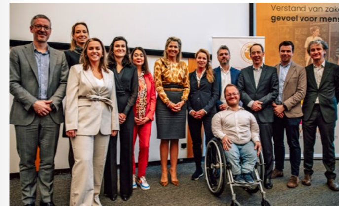
▲ Koningin Máxima bracht een werkbezoek aan het landelijke programma Zorgevaluatie & Gepast Gebruik (ZE&GG) in het VieCuri Medisch Centrum in Venlo.

Zorgevaluatie levert waardevolle kennis op voor passende zorg. Samen met partijen uit de medisch-specialistische zorg werkt de Federatie hieraan binnen het programma Zorgevaluatie & Gepast Gebruik (ZE&GG). De wetenschappelijke verenigingen spelen een belangrijke rol bij het bepalen van de juiste kennisvragen en zorgen ervoor dat nieuwe kennis sneller landt op de werkvloer. In samenwerking met ZE&GG en de wetenschappelijke verenigingen is de Federatie gestart met de doorontwikkeling van het door de maag-darm-leverartsen bedachte concept Less is more: een aanpak voor het verantwoord reduceren van minder effectieve zorg. Een ander initiatief vanuit ZE&GG is de pilot Versneld Evalueren. Doel is te komen tot betere ondersteuning van zorgevaluaties door wetenschappelijke verenigingen en zorginstellingen, zodat medisch specialisten sneller kunnen beschikken over relevante nieuwe kennis uit onderzoek. Daarnaast organiseerde de Federatie in 2024 samen met ZE&GG en ZonMw een congres over zorgevaluatie om kennis en ervaringen te delen.