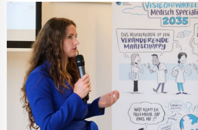
▲ Visietraject Medisch Specialist 2035 in Utrecht.

In 2024 groeide het visietraject Medisch Specialist 2035 in korte tijd uit tot een landelijke beweging. Meer dan 2.000 huidige en toekomstige medisch specialisten, zorgprofessionals, en experts leverden een actieve bijdrage tijdens ruim zestig werksessies.