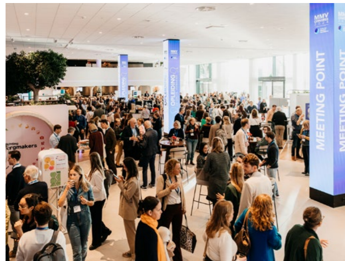
▲ MMV-congres Opleiding; de grote verbinder.