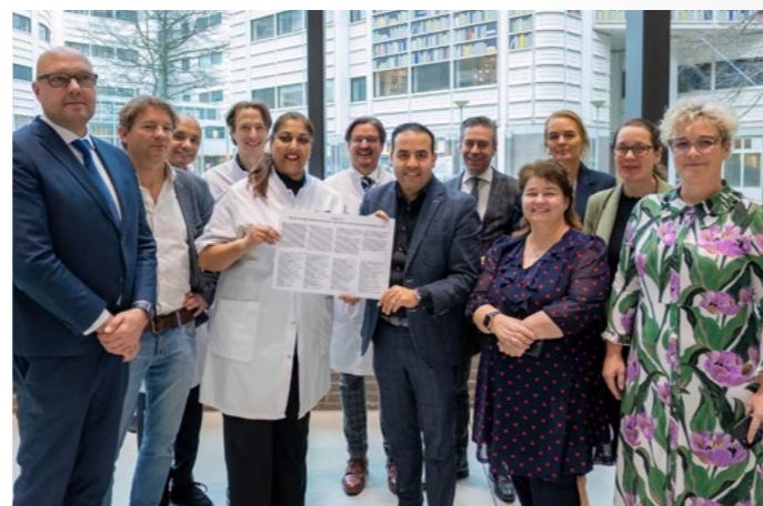
▲ 61 msb's bieden het manifest 'Medisch Specialistische Bedrijven: Innovatieve aanjagers van passende zorg' aan de leden van de Tweede Kamer aan. Met dit manifest roepen de msb's op om de keuzevrijheid van medisch specialisten te behouden.

In een reactie benadrukte de Federatie dat medisch specialisten vooroplopen met initiatieven om passende zorg mogelijk te maken, ongeacht of ze in dienstverband werken of verbonden zijn aan een msb. De Federatie staat voor het behoud van de vrije beroepskeuze voor medisch specialisten. In november nam de Tweede Kamer een motie aan dat de minister voor de zomer van 2025 met een plan moet komen om medisch specialisten in loondienst te brengen. Om invulling te geven aan afspraken uit het Integraal Zorgakkoord, publiceerde de Federatie samen met de NVZ de handreiking Gelijkgerichtheid - Samen werken aan passende zorg om de gelijkgerichtheid tussen ziekenhuizen en msb's te verbeteren. In diezelfde maand liepen de gemoederen op toen een verplicht dienstverband werd opgeworpen als optie binnen de onderhandelingen over de bovengenoemde bezuinigingen (zie kopje AZWA). Federatievoorzitter Piet-Hein Buiting riep Tweede Kamerleden op om niet in te stemmen met de voorgenomen maatregelen, want een verplicht